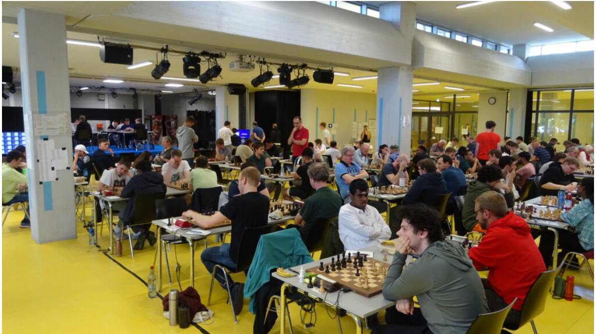
■ Spieler des A-Opens an den DGT-Brettern