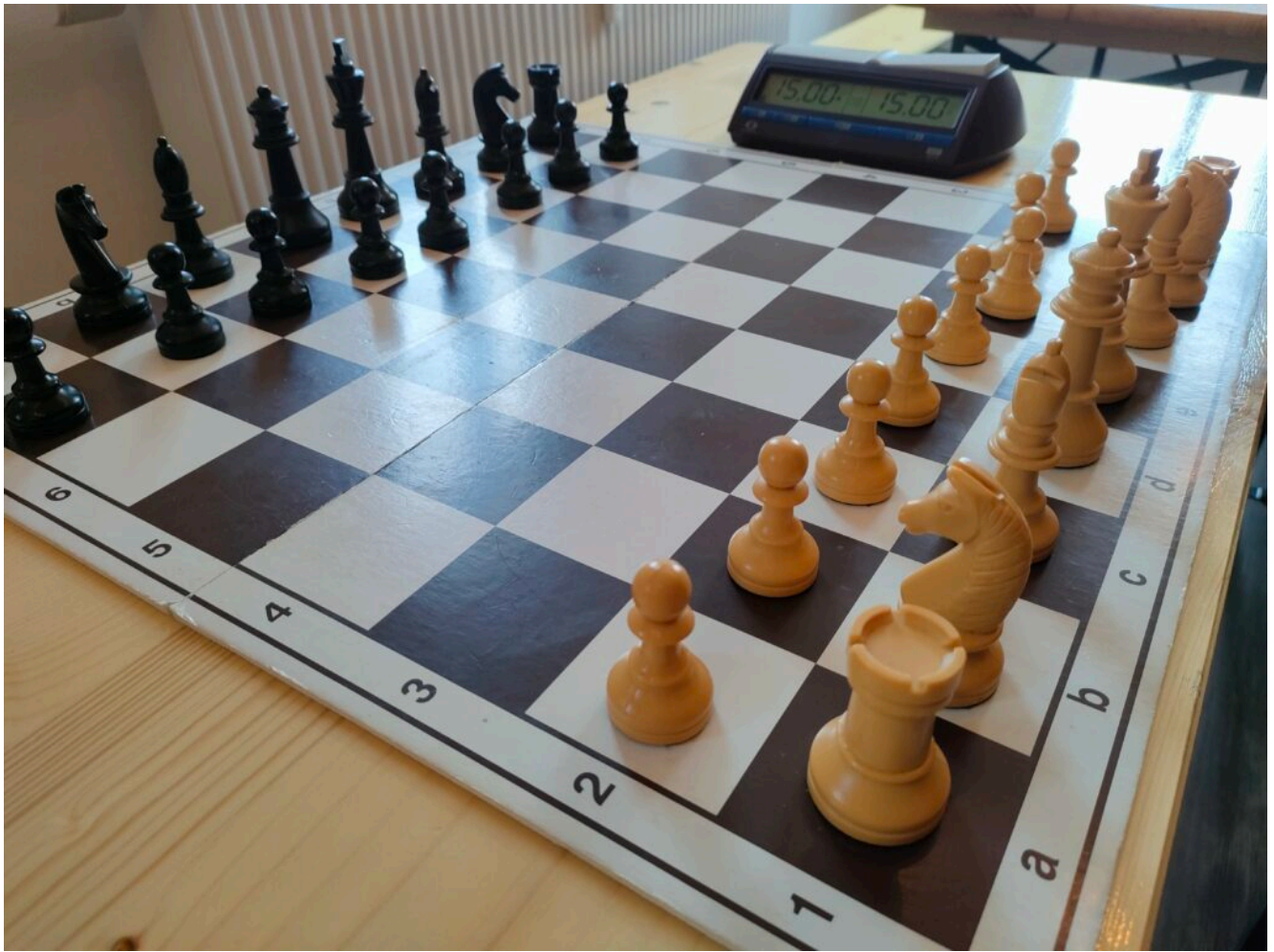
Mit Schachuhr, das war für viele neu