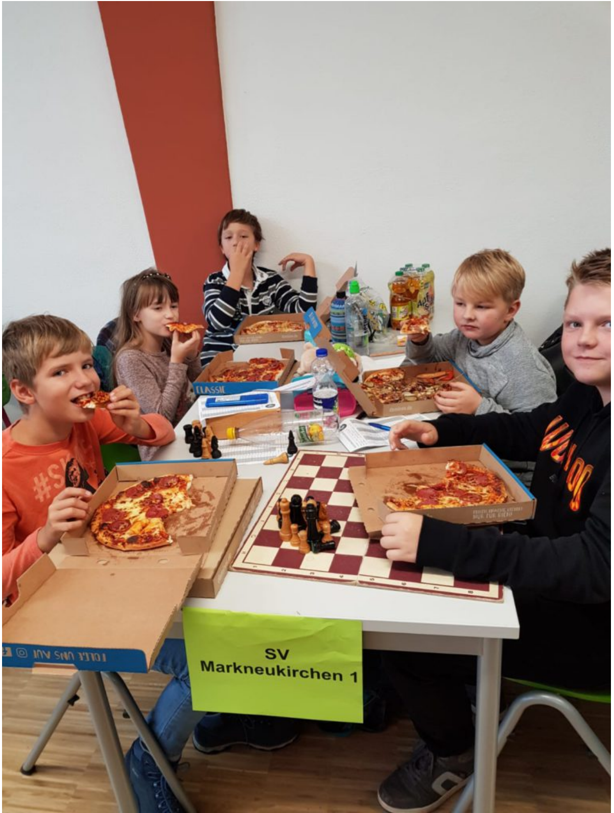
Nachwuchsgruppe bei der Stärkung