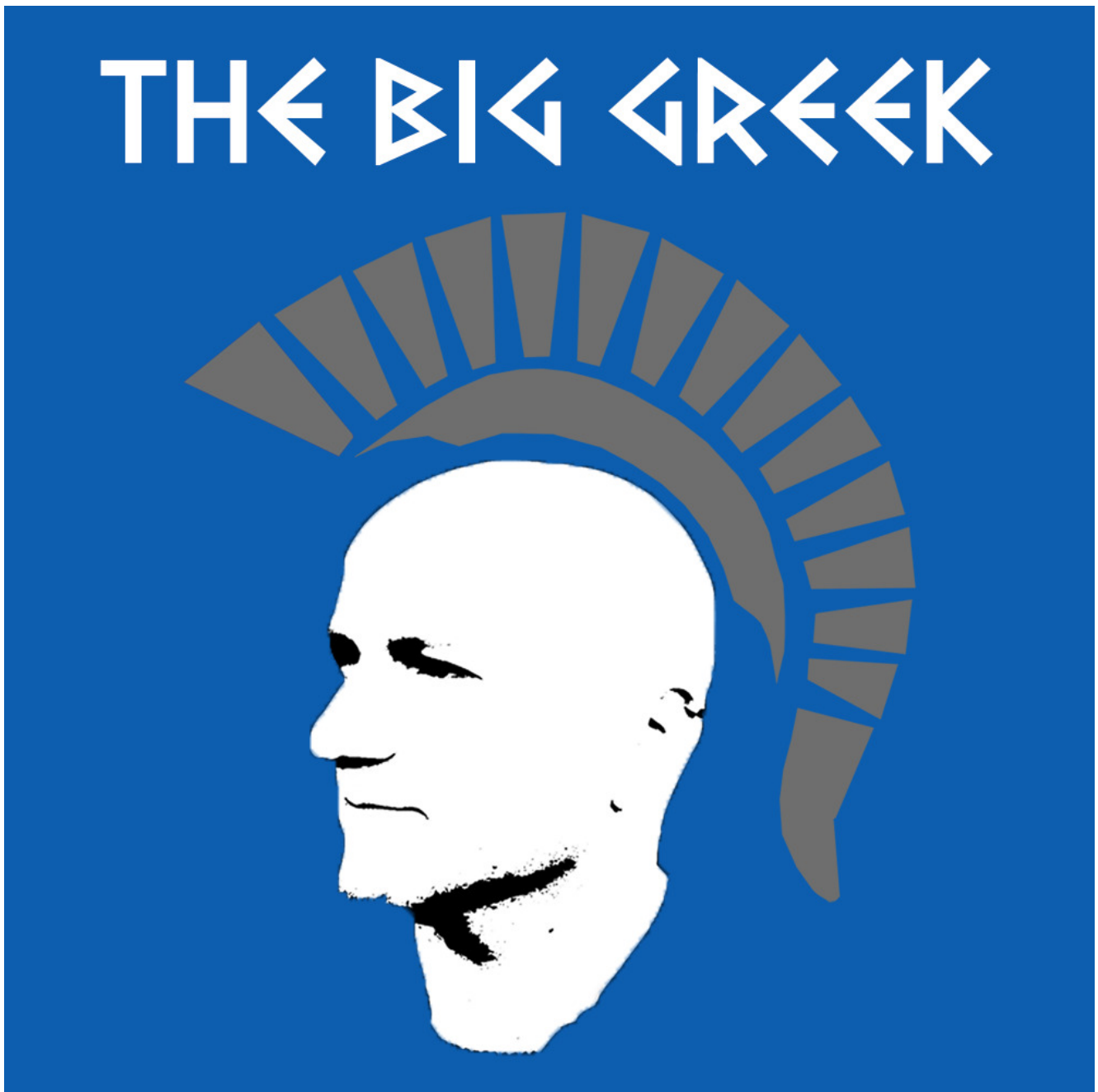
Bild des Kanals „The big Greek“