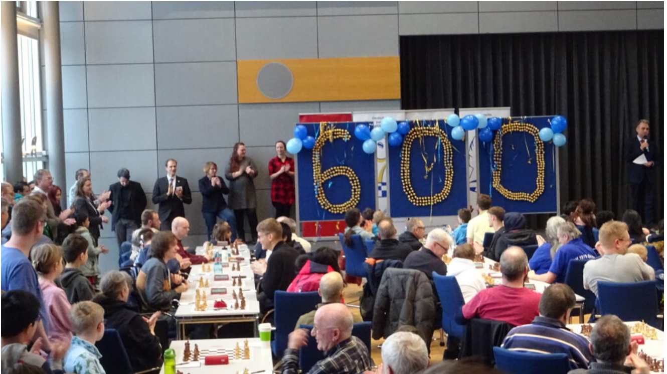
Rekord: über 600 Teilnehmer