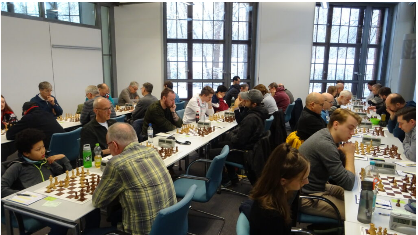
Spielsaal 2 der Gruppe C