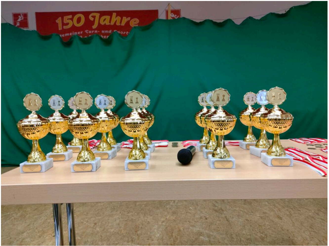
Objekte der Begierde