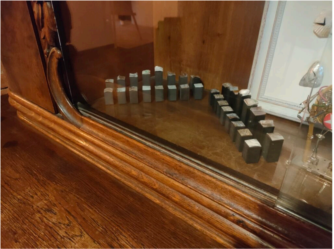
Schachfiguren mit Perlmutter verziert