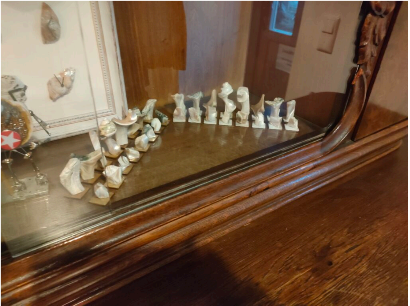
Schachfiguren aus Muschelschalen