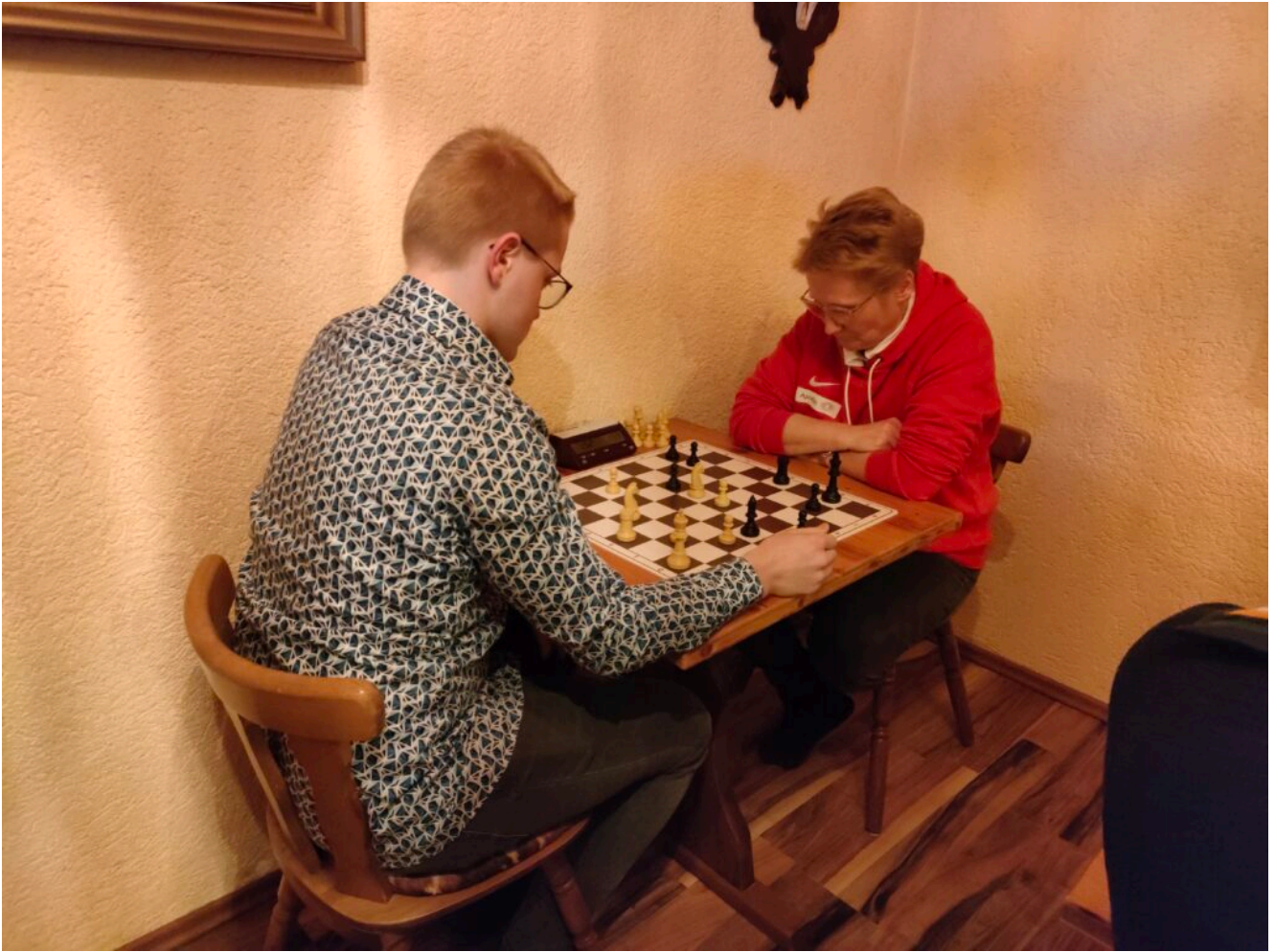
Sohn gegen Mutter