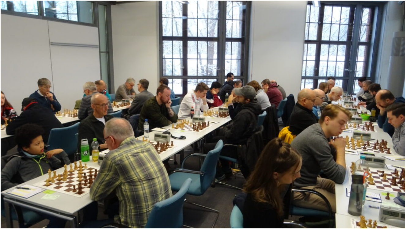
Spielsaal 2 der Gruppe C