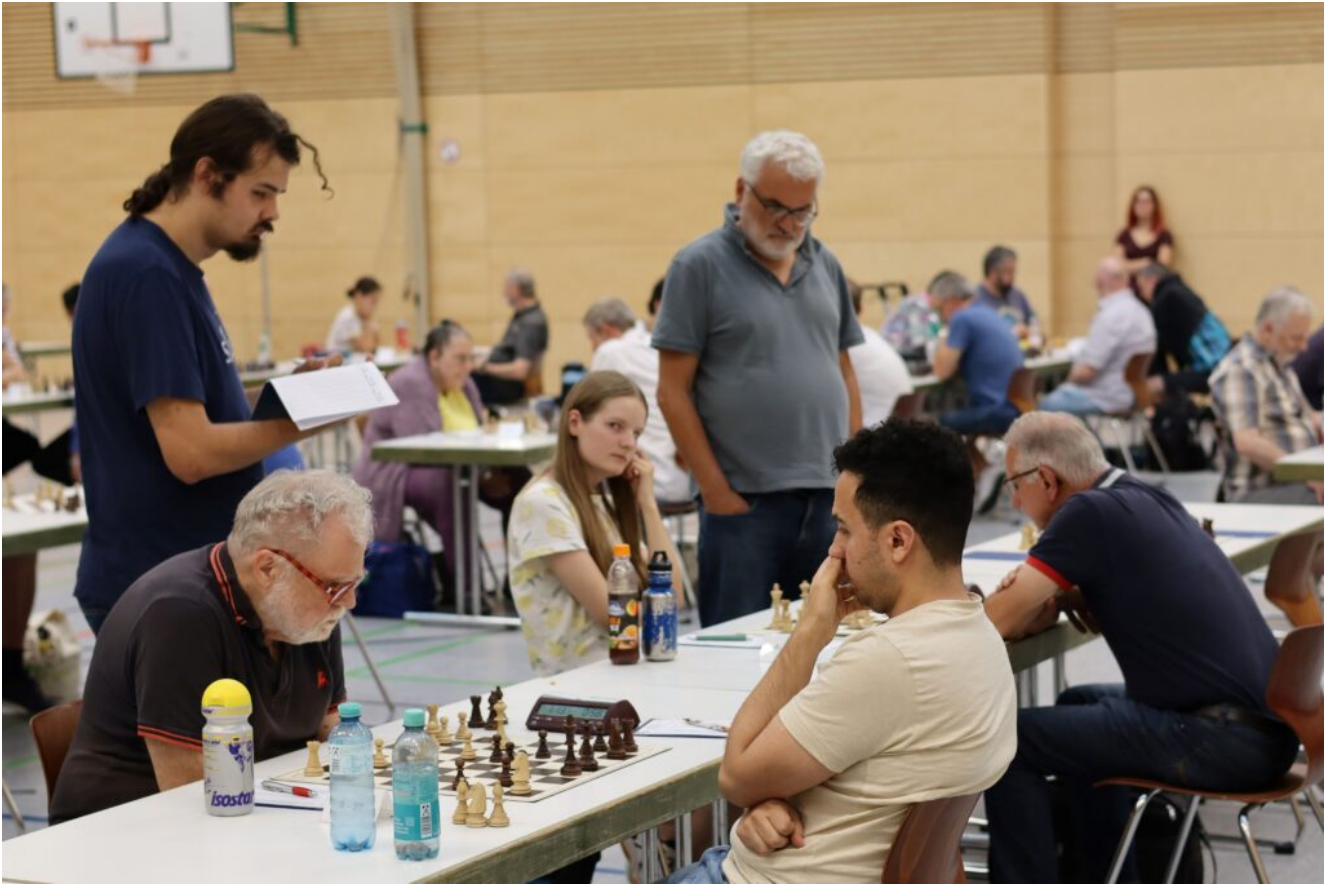
Der Schiedsrichter notiert die Zeiten