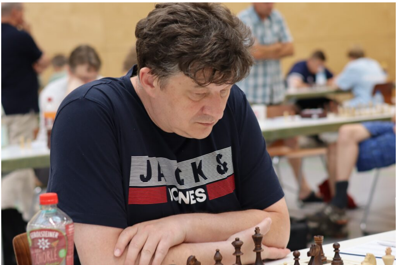
Zuversichtlich in der Eröffnung